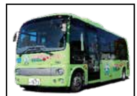
真庭市コミュニティバス